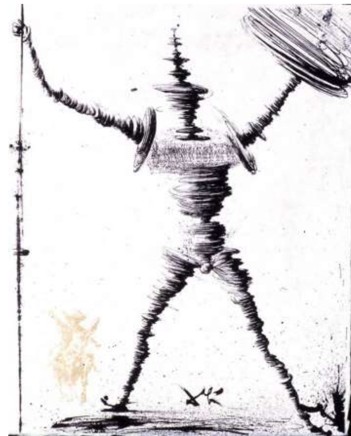
Salvador Dali, Don Quijote

Don Quijote pojavljuje se u dva stanja tijekom romana koji se mogu analizirati u kontekstu harmonije . Na samom početku i na kraju je normalan, dok je u ostalim dijelovima romana lud, kako predstavlja Cervantes. Prijelaz iz normalnog stanja (jednoličan život u skućenoj seoskoj sredini, bavljenje lovom i čitanjem knjiga o vitezovima) u stanje ludila opisan je sa stajališta pripovjedača u 3. licu, a ne junaka. Javlja se razlika između vlastita viđenja samog sebe i onoga kako ga drugi vide. Izmučen i pun gorčine vraća se kući, spava šest sati te se nakon toga budi normalan i vidi sebe kako ga i drugi vide. Don Quijote shvaća da su ga knjige opčinile te se želi ispričati svima zbog svog zaludnog ponašanja. Nakon što je sagledao sam sebe očima drugih, oslobođen je iluzija te umire. Psihološke osobine, zanimljivo, ostaju iste i pri zdravom i poremećenu razumu. Istinoljubiv je, velikodušan, razborit, iskren, pravdoljubiv, samilostan, požrtvovan i hrabar. Pritom Cervantes iskazuje besmislenost slavljaljubivosti u jednom društvu koje ne cijeni viteški poziv te koje ostavlja u bijedi one koji su zemlji donijeli moć i slavu.