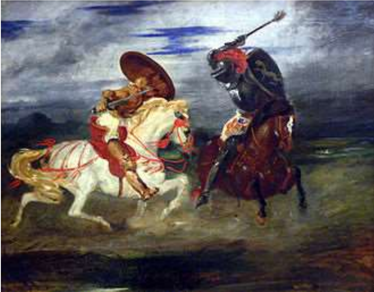
Eugène Delacroix, Borba vitezova

U španjolskoj renesansnoj književnosti postoje dva usporedna, suprotna načina pristupa književnosti - idealistički i realistički koji će u Don Quijoteu biti suočeni u ličnostima viteza-lutalice i njegova konjušara. Prvenstveno zamišljen kao viteški roman, Don Quijote ima harmonične odlike pastoralnog , pikarskog i ljubavnog romana.